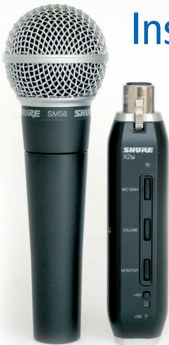
SM-58 und X2u gehören zum Shure Digital-Bundle

Shure SM Mikrofone gehören zu den Klassikern im Musikgeschäft. Der wohl prominenteste Vertreter dieser Modellreihe ist das SM-58, das 1966 als Weiterentwicklung des SM-57 auf den Markt kam. Seit dieser Zeit gilt das SM-58 als Evergreen unter den Gesangsmikrofonen. Bekannte Künstler rund um den Globus schwören auf den charakteristischen Sound und die sprichwörtliche Zuverlässigkeit des SM-58 Arbeitstiers. Auch beim PC-Recording wird gerne zum Klassiker von Shure gegriffen. „Wie kann ich mein SM-58 an meinen Computer anschließen?“, lautete nämlich eine der meistgestellten Fragen an die Shure-Ingenieure. Die Antwort präsentierte das traditionsreiche Unternehmen auf der diesjährigen Musikmesse Prolight & Sound in Frankfurt. Sie lautet X2u und ist ein XLR auf USB Interface, mit dem jedes XLR-Mikrofon an den USB-Anschluss eines Computers angeschlossen werden kann. Zusätzlich zur Einführung des neuen Interfaces ist die legendäre SM-Serie von Shure um zwei PC-Recording-Bundles erweitert worden. Eins davon ist das SM-58 + X2u USB Digital-Bundle. Ob für Homerecording, Podcasting oder andere digitale Anwendungen, mit dem neuen Package ist das Mikro fix an jedem Rechner angeschlossen und die Aufnahme kann beginnen.