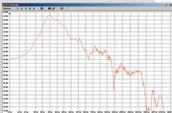
Grafik 1: FFT-Anzeige des SM-58 über X2u-Interface aufgenommen

Das Interface lässt sich spielend leicht am Mikrofon andocken