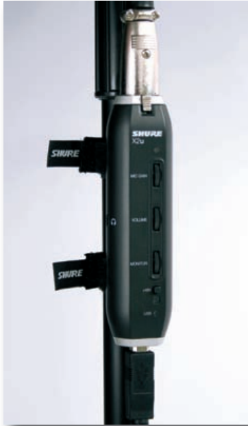
Mitgelieferte Klettbänder halten das Interface sicher am Mikrostativ

Jeder, der schnell und unproblematisch Gesang oder Sprache über den USB-Port seines Rechners auf die Festplatte bringen möchte, kann mit dem SM-58 + X2u USB Digital-Bundle sofort loslegen. Das Interface wird einfach angeschlossen und ist dank Plug and Play-Funktionalität sofort einsetzbar, zusätzliche Treiber oder Software werden für die Installation nicht benötigt. Während der Aufnahme kann das Mikrofonsignal latenzfrei über Kopfhörer abgehört werden. Auch das Zumischen von bereits aufgezeichneten Signalen ist ohne Probleme machbar. Das X2u verträgt sich obendrein ausgezeichnet mit anderen Mikrofonen. Selbst